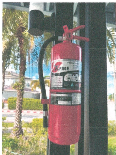
รูปภาพที่ 2.21 ถังดับเพลิงแบบมือถือ