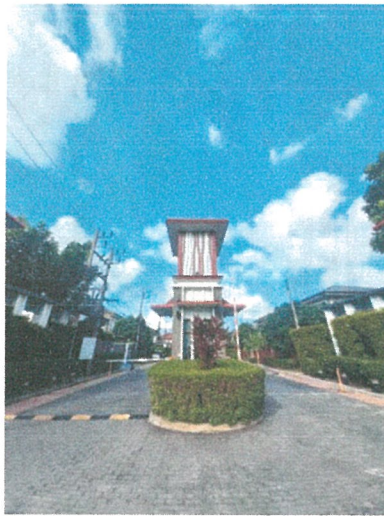
รูปภาพที่ 2.5 ทางเข้า-ออกโครงการ