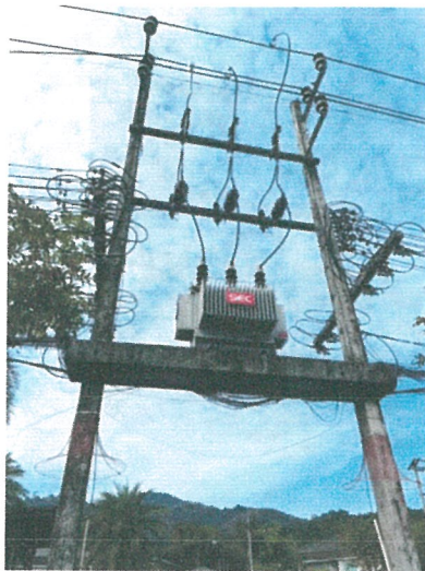
รูปภาพที่ 2.18 หม้อแปลงไฟฟ้า