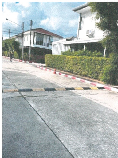
รูปภาพที่ 2.8 สันนูนบนผิวถนน