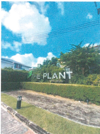
รูปภาพที่ 2.3 ป้ายชื่อโครงการ