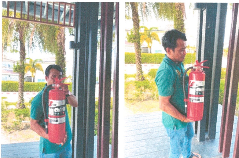
รูปภาพที่ 2.28 ตรวจเช็คถังดับเพลิง