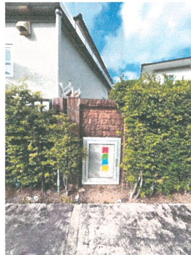
รูปภาพที่ 2.15 ห้องพักขยะบริเวณด้านหน้าของแปลงย่อย รูปภาพที่ 2.16 ไม้พุ่มโดยรอบห้องพักขยะบริเวณด้านหน้าของแปลงย่อย