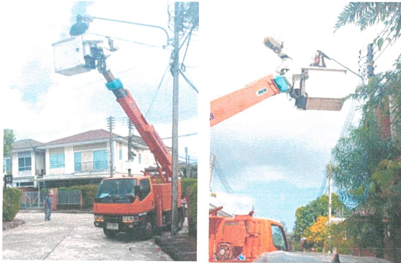
รูปภาพที่ 2.27 บำรุงรักษาไฟฟ้าส่วนกลาง