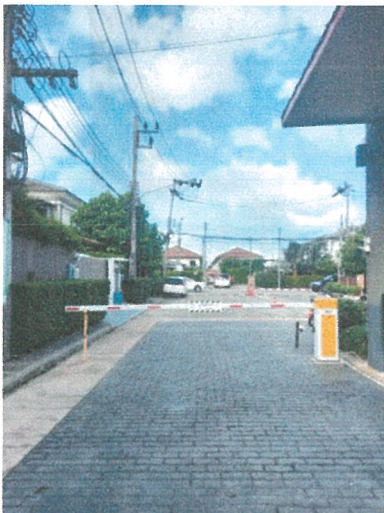
รูปภาพที่ 2.7 ไม้กั้นทางเข้า-ออก