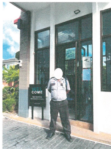
รูปภาพที่ 2.4 เจ้าหน้าที่รักษาความปลอดภัย