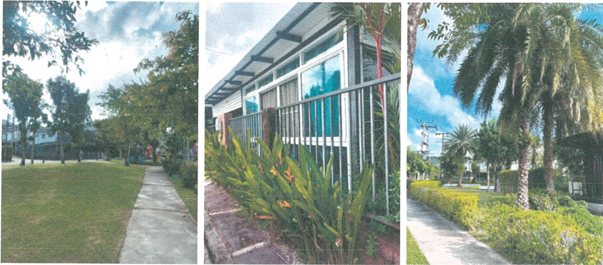
รูปภาพที่ 2.1 พื้นที่สีเขียวภายในโครงการ