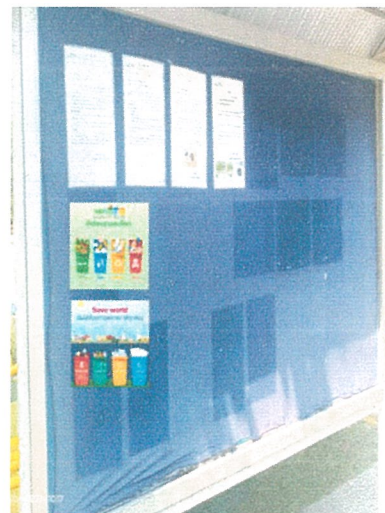
รูปภาพที่ 2.25 ป้ายรณรงค์ทิ้งขยะลงถัง