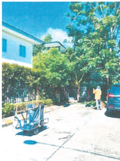
รูปภาพที่ 2.17 การดูแลความเรียบร้อยบริเวณห้องพักขยะด้านหน้าของแปลงย่อย