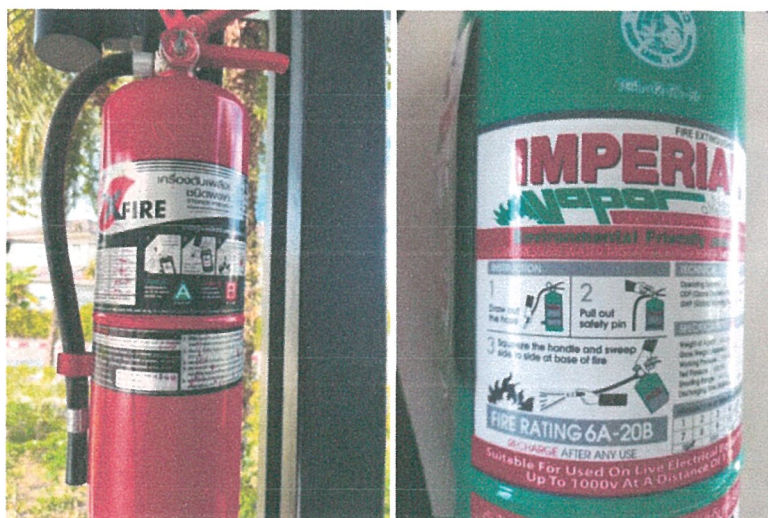
รูปภาพที่ 2.22 ป้ายแสดงวิธีการใช้งานถังดับเพลิง