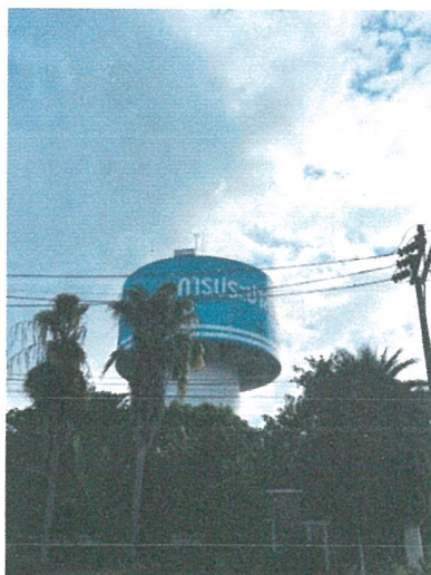
รูปภาพที่ 2.12 หอถังน้ำประปาภายในโครงการ