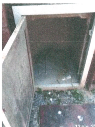
รูปภาพที่ 2.26 ทำความสะอาดจุดพักมูลฝอย