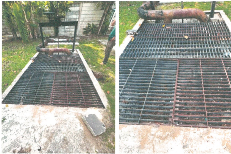
รูปภาพที่ 2.14 ตะแกรงดักขยะ