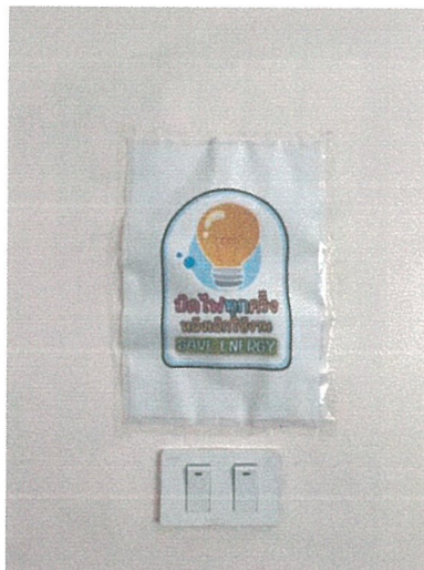
รูปภาพที่ 2.20 ป้ายรณรงค์ประหยัดไฟฟ้า