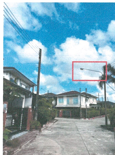
รูปภาพที่ 2.11 ไฟฟ้าส่องสว่าง ภายในโครงการ