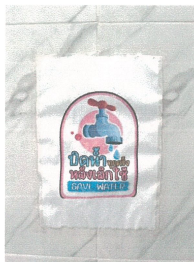
รูปภาพที่ 2.13 ป้ายรณรงค์ประหยัดน้ำ