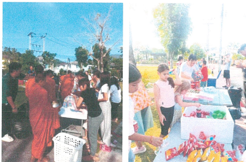
รูปภาพที่ 2.29 กิจกรรมภายในโครงการ