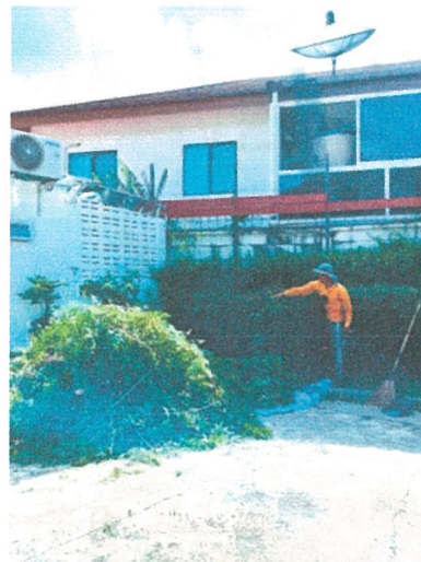
รูปภาพที่ 2.23 งานดูแลสวน