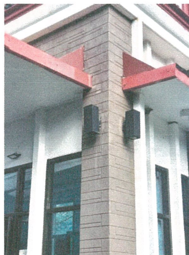
รูปภาพที่ 2.9 ไฟฟ้าส่องสว่าง บริเวณทางเข้า-ออก