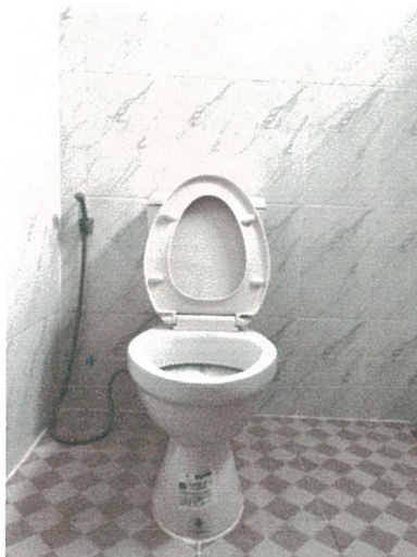
รูปภาพที่ 2.24 สุขภัณฑ์ประหยัคน้ำ