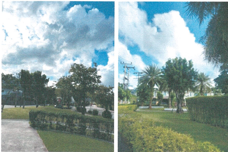
รูปภาพที่ 2.2 จุดรวมพล