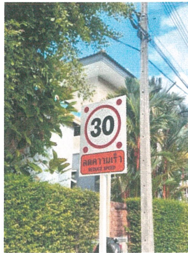
รูปภาพที่ 2.6 ป้ายจำกัดความเร็ว