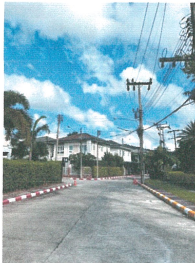
รูปภาพที่ 2.10 เส้นขาวแดง บริเวณไหล่ทางในพื้นที่ห้ามจอดรถ